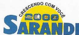
TABELA DE PROGRESSÃO SALARIAL LINHA DE PROGRESSÃO SALARIAL

Rua José Emiliano de Gusmão, 565 - Cx. P. 71 - Fone/Fax: (0xx44) 264-2777 CEP 87111-230 Sarandi Paraná